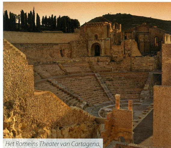
Het Romeins Theater van Cartagena.

la Manga del Mar Menor . Door de ligging aan twee zeeën, heb je er de keuze uit het warme en kalme water van de Mar Menor of de welgekende Middellandse Zee. De vuurtoren van Cabo de Palos kijkt uit over het begin van de Manga en biedt een adembenemend uitzicht over de gehele lengte. Door het hoge zoutgehalte, en daardoor ook het hogere drijfgehalte, is het de ideale uitvalsbasis voor beginnende zeilers. In het watersportcentrum van San Pedro de Pinatar kan je terecht voor verschillende watersporten: beginners tot experts kunnen er zeilen, windsurfen, kitesurfen, kajakken, duiken en nog veel meer. De hotels zijn aangepast aan de sportieve bezoekers. Zo heeft het Manga Club Resort 4 golfbanen die tot de beste in Europa behoren, 28 tennisbanen en 8 voetbalvelden. Wist je dat RSC Anderlecht er elk jaar verblijft?