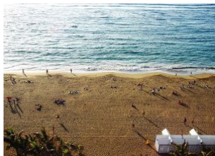
Las Canteras, en Las Palmas de Gran Canaria.