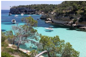
La cala de Portals Vells en Calvià (Mallorca).