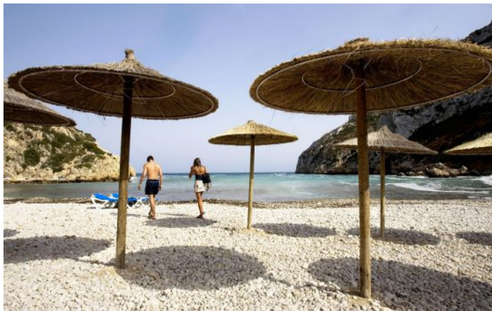
La Granadella, en la costa alicantina.

Archivado en: Clasificación Playas Turismo playa Viajes Destinos turísticos Espacios naturales España Ofertas turísticas Turismo Medio ambiente