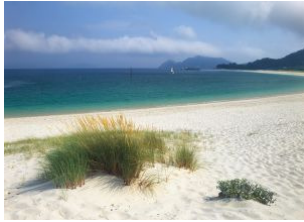
La playa de Rodas, en las islas Cíes (Pontevedra).