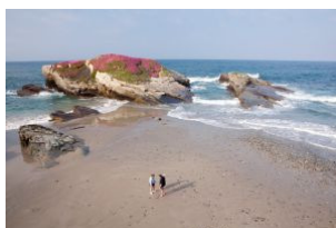
La playa de As Illas, en Ribadeo (Lugo).