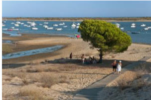
Playa de la Flecha del Rompido, en Huelva. / JOSÉ LUCAS