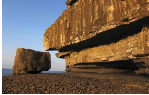
La Arena, en Arnuelo (Cantabria).