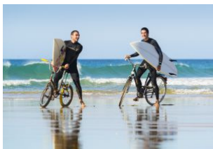
Surferos en El Palmar (Cádiz).