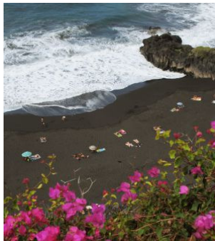
La playa del Bollullo, en La Orotava (Tenerife).