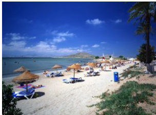
Playa de Los Alcázares, en Murcia.