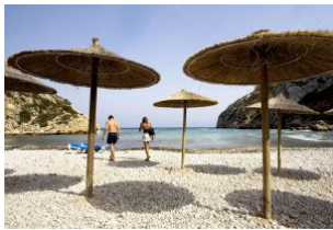
Cala de La Granadella, en Xàbia/Jávea (Alicante).