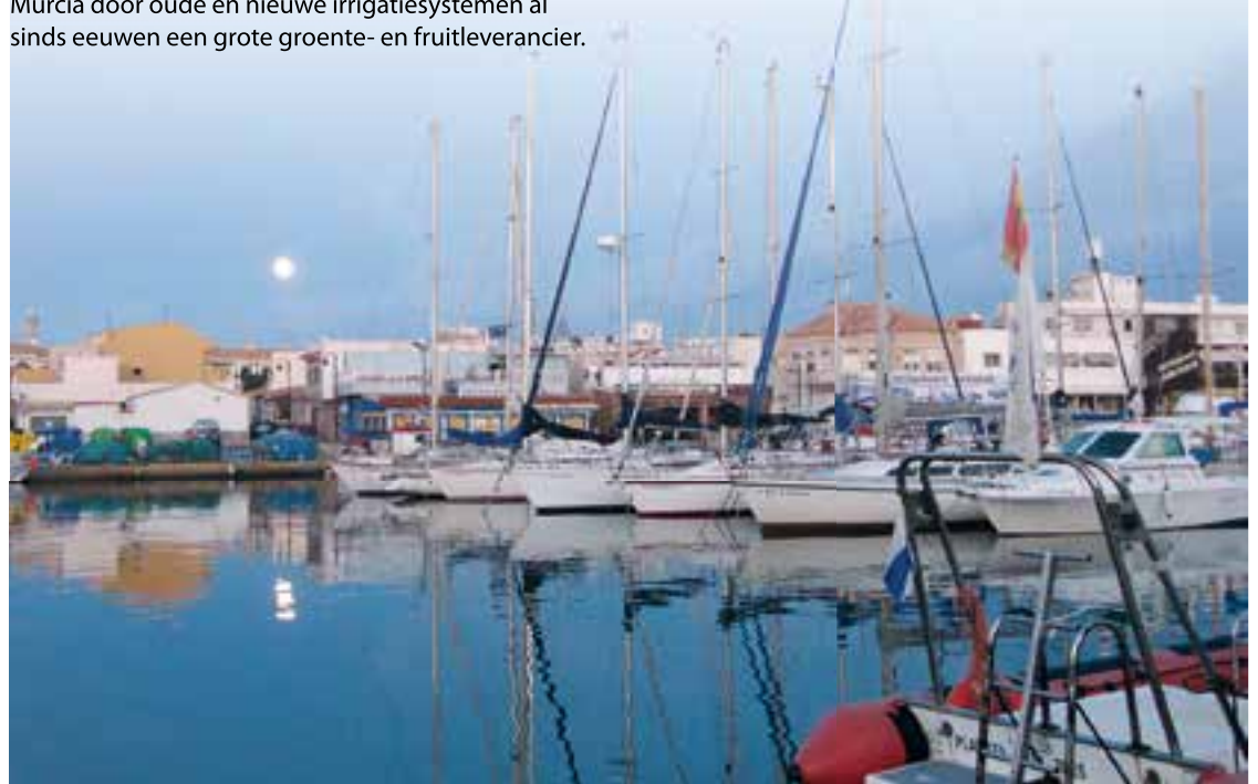
Cabo de Palos

Op vele plaatsen zijn wandel- en fietsroutes uitgezet, uiteraard heel vaak met steenslag. Maar ook voor wielrenners biedt de regio kansen, bijvoorbeeld door of rond de Sierra Espuna. Vele wegen door de bossen leiden hier naar El Berro (met camping), waar het afgelegen dorp samenwerkt in het herstel van huizen, de vruchtbare tuinen en de dienstverlening aan gasten. Nergens is hier de zee ver weg met op tal van plaatsen een weids uitzicht over het landschap. Een verfrissend briesje maakt het verblijf het aangenaamst in de maanden april en mei.