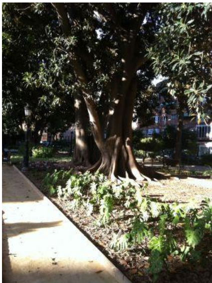
Un ficus decimónica en el parque de Floridablanca (Murcia).

El SL-MU 10 discurre por zonas ajardinadas y peatonales, cruza calles y avenidas por pasos de cebra y semáforos, y está señalizado como sendero homologado. Para los más entendidos, añadiremos que el tipo de recorrido es circular (comienza y termina en la Glorieta de España), de 6,7 kilómetros de longitud, con un desnivel de 0 metros, un tiempo estimado de una hora 40 minutos y dificultad baja.