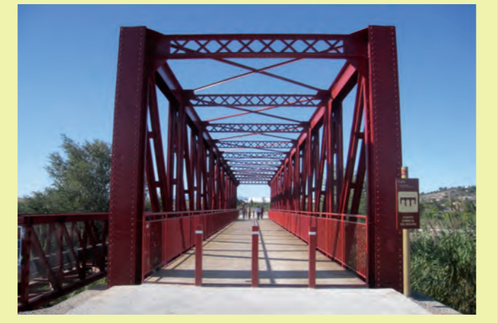
PUENTE SOBRE EL RÍO SEGURA