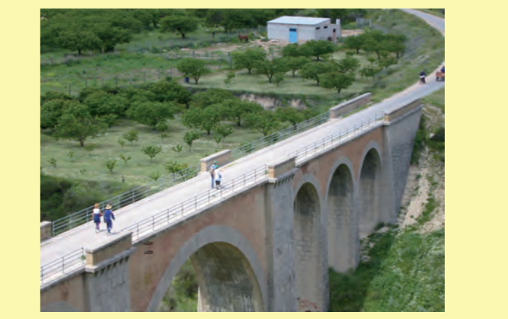
VIADUCTO DEL RÍO QUIPAR