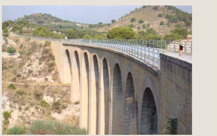
VIADUCTO DE LA LUZ, MULA