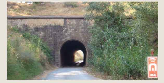
TÚNEL EN MULA

La Vía Verde del Noroeste permite disfrutar de forma respetuosa de un entorno natural atractivo y lleno de historia.