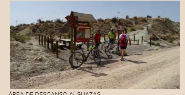
ÁREA DE DESCANSO ALGUAZAS

Abandonamos la vega del Segura para transitar por la cuenca del río Mula, afluente del anterior, pasando por las localidades de Campos del Río , Albudeite antes de llegar a Mula . Estamos en la zona más árida de la Vía Verde, de vez en cuando salpicada por pequeños huertos. En el paisaje dominan las colinas de suaves laderas. Algunos de los hitos más importantes en el paisaje lo forman la Muela de Albudeite, el barranco del Moroy, la rambla de Perea, con sus grandes depósitos aluviales de los márgenes. Los viaductos que atraviesan algunos de estos enclaves son paradas obligatorias para observar la flora y fauna local.