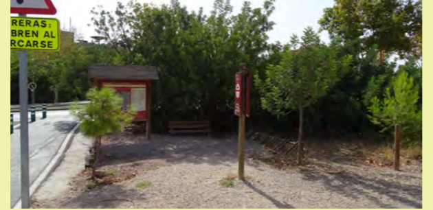
ÁREA DE DESCANSO CAMPUS DE ESPINARDO

Junto al Centro Social Universitario del campus de la Universidad de Murcia se encuentra el inicio de la ruta. Desde aquí pasamos junto al Cabezo del Aire y atravesamos el único túnel de este tramo que nos conduce hasta la Ribera de Molina y Torrealta para llegar a Molina de Segura . La Vía Verde discurre paralela al río Segura, para luego girar cerca de 90° en dirección oeste, lo que nos obligará a cruzar el río y atravesar su vega hasta llegar a Alguazas . La influencia del río Segura se hace notar a lo largo de esta primera etapa, tanto desde el punto de vista botánico como faunístico. Poco a poco, ascenderemos desde la vega baja hasta la vega media por uno de los corredores naturales más característicos, la llanura de inundación que forma la fértil Huerta de Murcia.