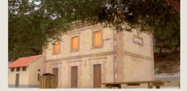
ALBERGUE DE LA LUZ EN MULA