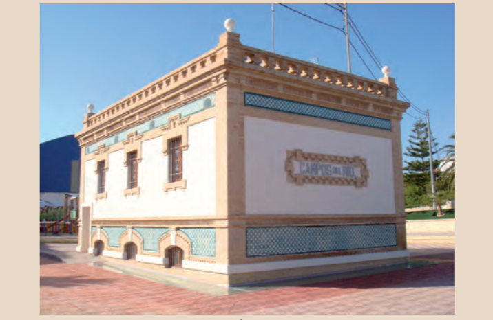
ALBERGUE EN CAMPOS DEL RÍO