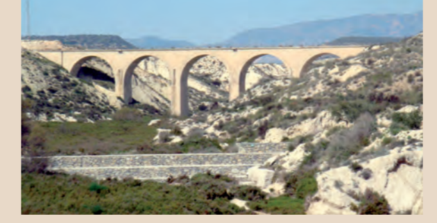
VIADUCTO RAMBLA DE GRACIA