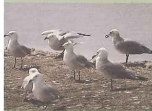
Gaviota de Audouin

La fauna es muy diversa. En los ambientes terrestres sedimentarios y de montaña abundan los reptiles, en-