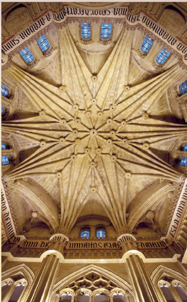
Capilla de los Vélez (16)

La Capilla de los Vélez (16) , espléndida obra del gótico tardío español, fue construida entre 1490 y 1507. Sus promotores, como consta en la inscripción que rodea el perímetro superior, los Chacón - Fajardo, formaban parte de la alta nobleza del Reino de Murcia. La ausencia de enterramientos y abundancia de escudos le otorgan un carácter civil, a la vez que ensalzan las glorias militares del linaje familiar. Trabajada la piedra como si de una pieza de orfebrería se tratase, la sucesión de arcos y galerías ciegas está coronada por una bóveda estrellada de diez puntas.