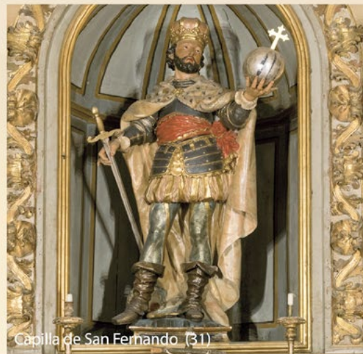
Capilla de San Fernando (31)

El incendio que asoló al templo en 1854 destruyó el retablo gótico del altar mayor , la sillería del coro y los dos órganos barrocos . En años posteriores se sustituyeron