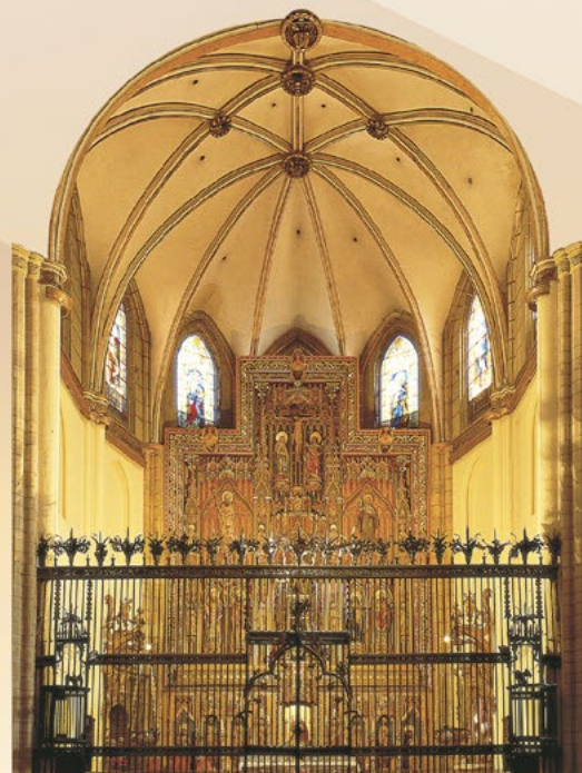
Altar mayor (11)

Dominando la nave principal encontramos el coro (11) , cuya sillería del siglo XVI presenta la iconografía habitual de santos, mártires, papas, virtudes y otros símbolos cristianos. La parte superior está coronada por el órgano , una notable pieza que podemos considerar una auténtica referencia del siglo XIX en su género.