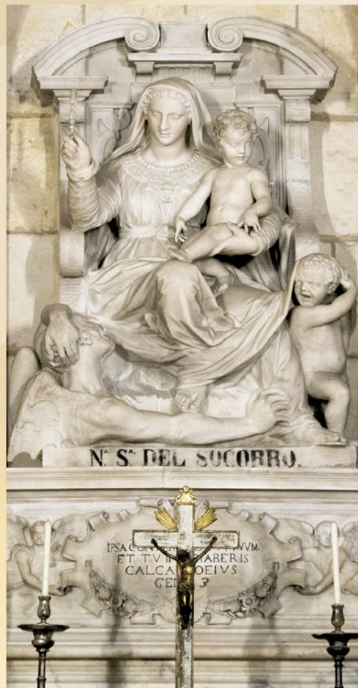
Capilla del Bautismo (32)