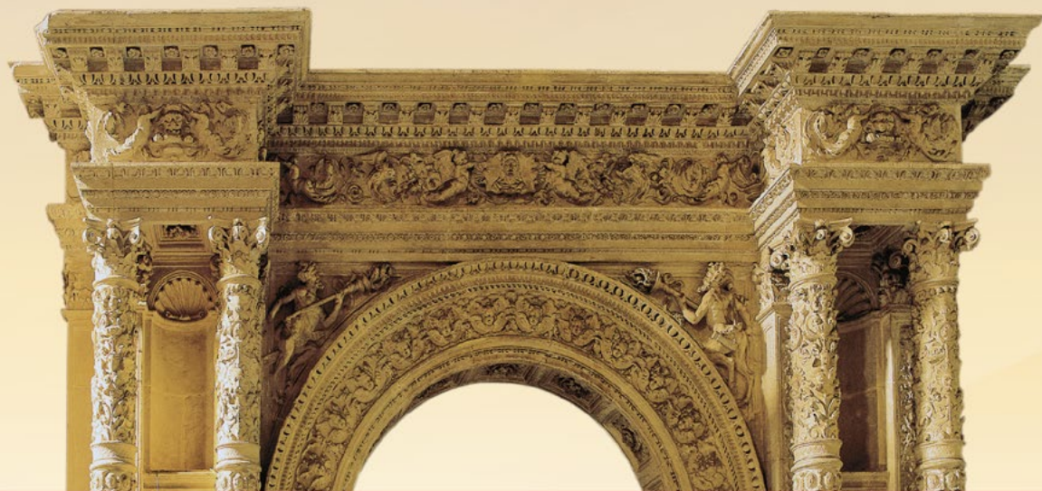
Portada de la Antesacristía (23)

Atravesado el crucero, nos encontramos la Capilla de la Soledad (25), así llamada por estar presidida por una imagen de la Virgen