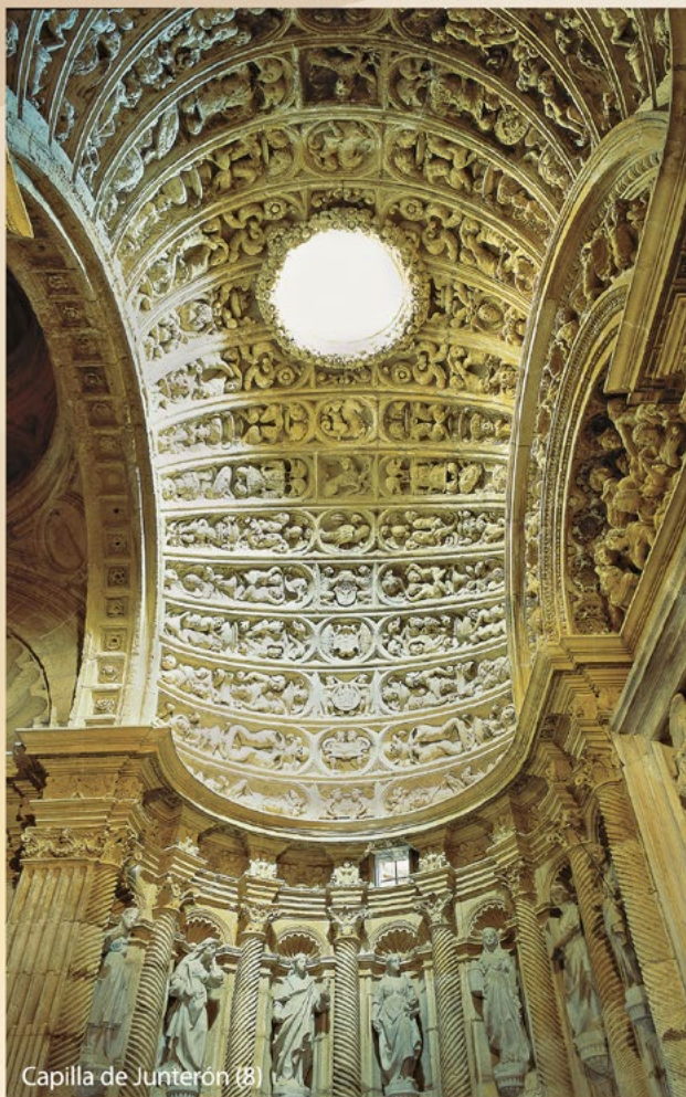
Capilla de Junterón (8)

Antes de llegar al crucero, cierran el tramo sur las capillas de San José (9) y de San Ignacio de Loyola (10) , con sendos retablos dedicados a los respectivos titulares.