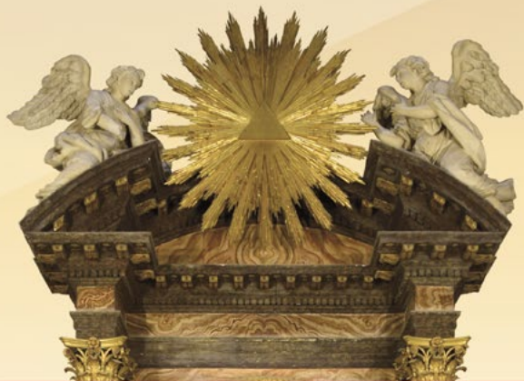
Capilla Beato Hibernón (29)

Cerrando el recorrido, las capillas de San Fernando (31) , cuya escultura realizó Nicolás de Bussy, y la del Bautismo (32) , en cuya pared se enclava un imponente retablo de mármol, dominado por la espléndida escultura de la Virgen del Socorro, obra de Jerónimo Quijano.