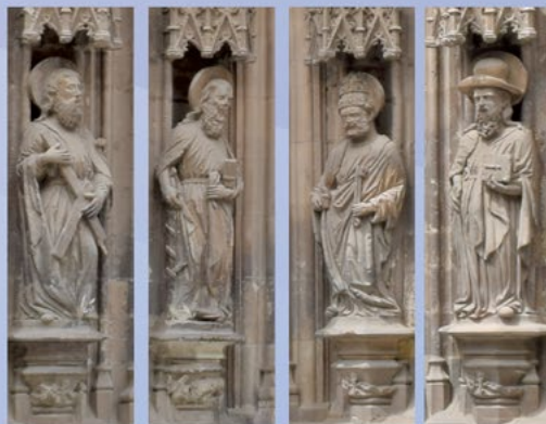
San Andrés San Pablo San Pedro Santiago

San Andrés , con el atributo que hace alusión a su martirio: una cruz en forma de aspa. San Pablo es reconocible por sujetar una espada y un libro. San Pedro se identifica por las dos llaves que lleva en su mano izquierda: una es la del cielo, otra, la de la tierra. Santiago , tocado con un peculiar sombrero, no debió de ser casual: se creía que su entrada en España se había efectuado por Carthago Nova, actual Cartagena. Sobre ellos, en las arquivoltas, los reyes de Judá y profetas y ángeles con instrumentos musicales.