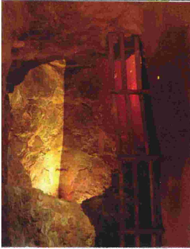
"Lago interior Mina Agrupa Vicenta"