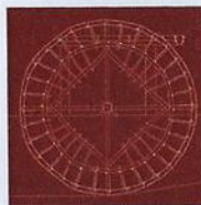
Patrimonio hidráulico de la Huerta de Blanca