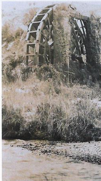
Noria del Campillo hacia 1890