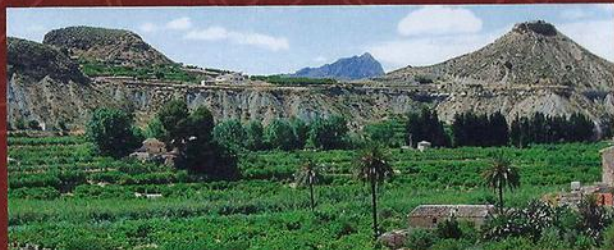
Huerta de Blanca