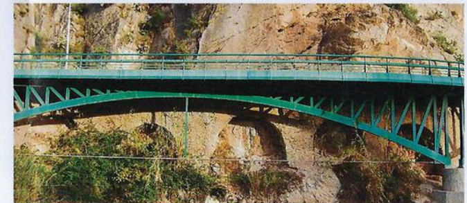
Acueducto de las Excanales de la Acequia Principal de Blanca ocultado por los posteriores ensanches de la carretera