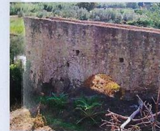
Acueducto de la Noria de Corona (Abarán)