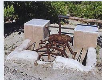
Ceña (arte) conservada en la Acequia de Arriba