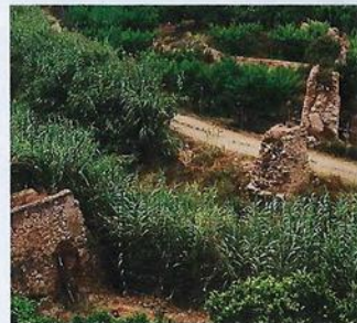
Acueducto de la Rambla de la Tejera de la Acequia de Charrara