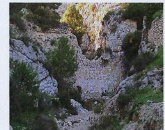
Presa del Pantano