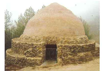
Puit de neige