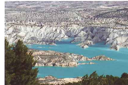
Ravins de Gebas