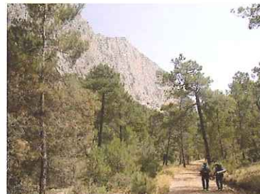
Parois de Leiva